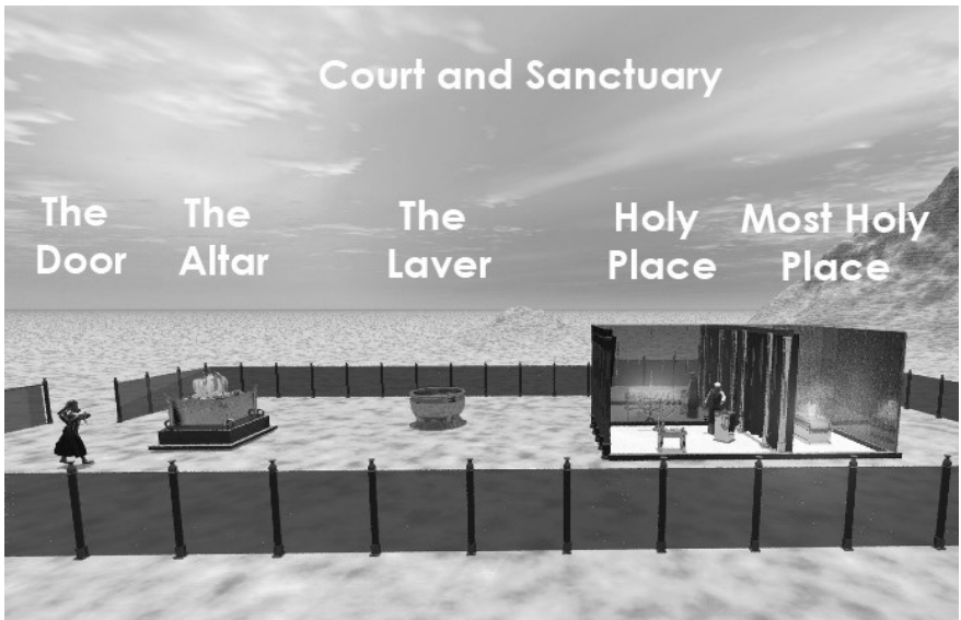
ပုံပါစာများ (ပုံ - ၁) ---- Court and Sanctuary - တဲတော်ဝန်းနှင့် သန့်ရှင်းရာဌာနတော် တံခါး၊ မီးရှိရာယဇ်ပလ္လင်၊ အင်တုံ (ရေစလုံ)၊ သန့်ရှင်းသောအခန်း၊ အသန့်ရှင်းဆုံးသောအခန်း

ကလေးဘဝက ကျမ်းစာဖတ်ရှုခဲ့ဖူးသည့် အတွေ့အကြုံတစ်ခုကို ကျွန်ုပ်ပြန်သတိရမိသည်။ ကျမ်းစာဖတ်ရှုရင်း ထွက်မြောက်ရာကျမ်းသို့ ရောက်လာသောအခါ ကျွန်ုပ်အတွက် အလွန်ခက်ခဲလာခဲ့သည်။ ဘုရားသခင်၏သန့်ရှင်းရာဌာနတော် ဆောက်လုပ်ခြင်းအမှုအတွက် ပေးထားသော ညွှန်ကြားချက်များအကြောင်းကို ဖတ်ရှုနေရခြင်းသည် ၁၂ အရွယ် ကလေးတစ်ယောက်အဖို့ အလွန်ပင် ငြီးငွေ့စရာကောင်းလှသည်။ သို့ပါသော်လည်း ဤညွှန်ကြားချက်များထဲတွင် ကျွန်ုပ်တို့အဖို့ ဧဝံဂေလိသတင်းစကားကို ဖွင့်ဟပြပေးသည့် အဖိုးထိုက်သမ္မာတရားပါရှိနေပါသည်။ ပုံတစ်ပုံတည်းအားဖြင့် ထောင်နှင့်ချီသောစကားလုံးများကို ခြယ်မှုန်းပြနိုင်သည် ဆိုသည့်စကားအတိုင်း၊ အောက်ဖော်ပြ ရုပ်ပုံအချို့တို့မှ သန့်ရှင်းရာဌာနတော်၏ ပုံစံကြမ်းတစ်ခုကို ကျွန်ုပ်တို့ ရယူနိုင်ပါသည်။